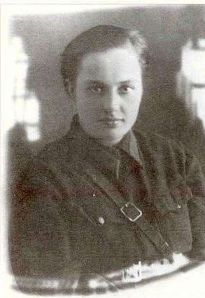
Бою-снайпер 54-го стрелкового имени Степана Разина полка Л.М. Павличенко. Одесса, август 1941 г.