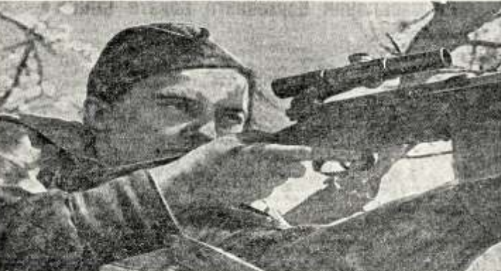
Людмила Павличенко — одна из героических защитниц Севастополя, лучшей снайпер Н-ской части, уничтожившая свыше 300 немцев. Фото И. Макарова

Из материалов газеты "Правда" № 172 от 21.06.1942 г.