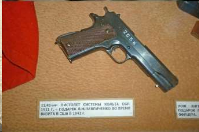
11,43-мм. ПИСТОЛЕТ СИСТЕМЫ КОЛЬТА СФ. 1911 Г. - ПОДАРОН ДЛ. ПАВЛИЧЕНКО ВО ВРЕМЯ ВИСИТА В США В 1942 Г.