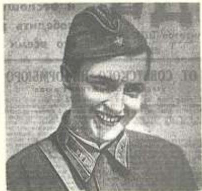
Снайпер Людмила ПАВЛИЧЕНКО