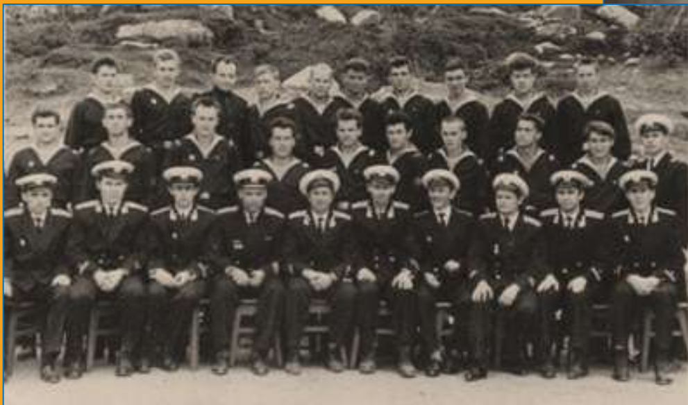
Дедушка в звании лейтенанта в составе экипажа АПЛ «К-5», 1964 год

– Трудно ли было служить на подводной лодке?