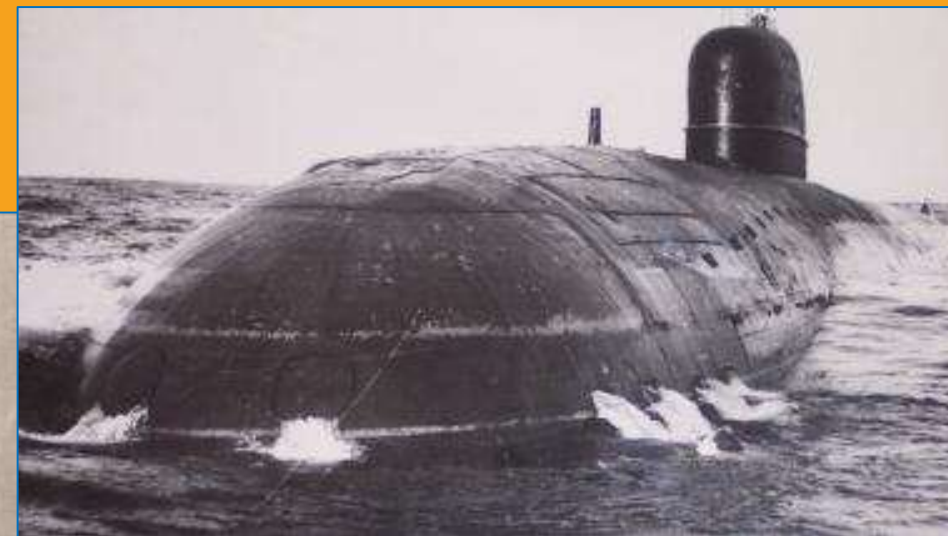
Атомная подводная лодка «К-5» в базе Гремиха