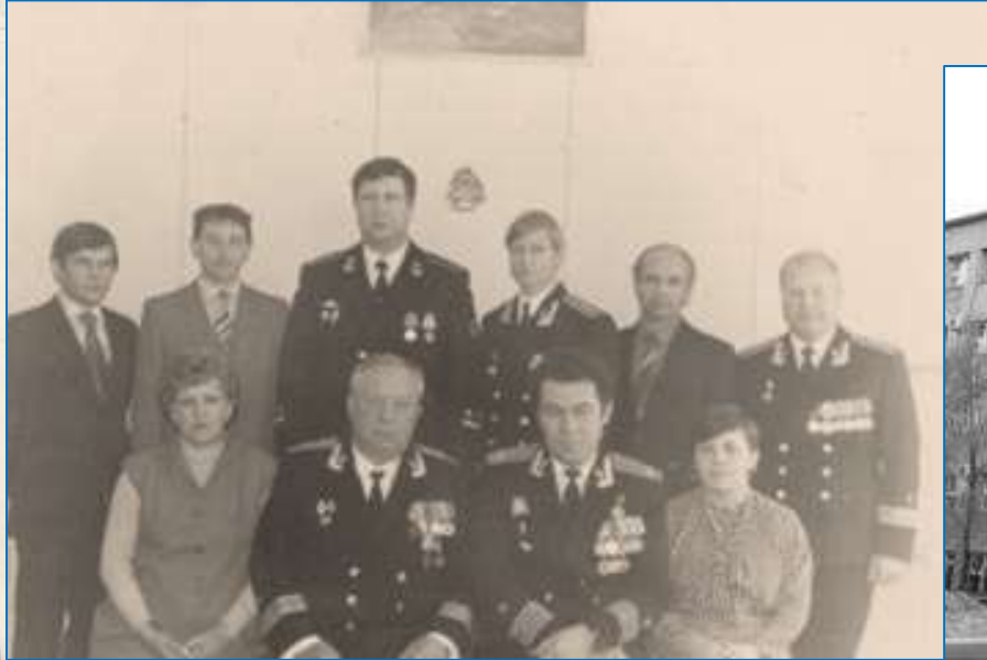
С коллективом военного представительства МО СССР, 1984 год