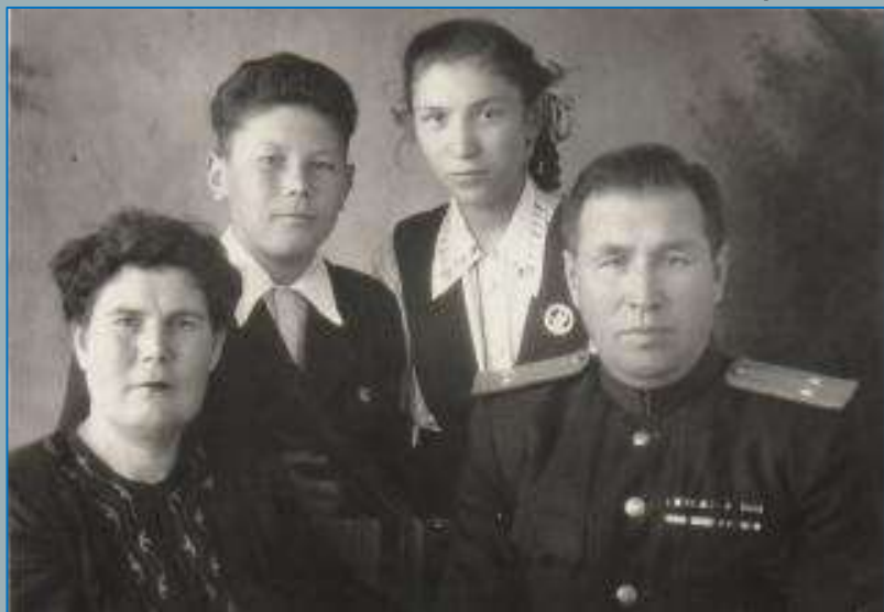
С родителями и сестрой, 1951 год

Родился в 1940 году в семье кадрового военного в городе Новосибирске. Является ребёнком войны. В 1957 году окончил среднюю школу. В 1957-1958 гг. работал слесарем-сборщиком на заводе имени Чкалова в г. Новосибирске