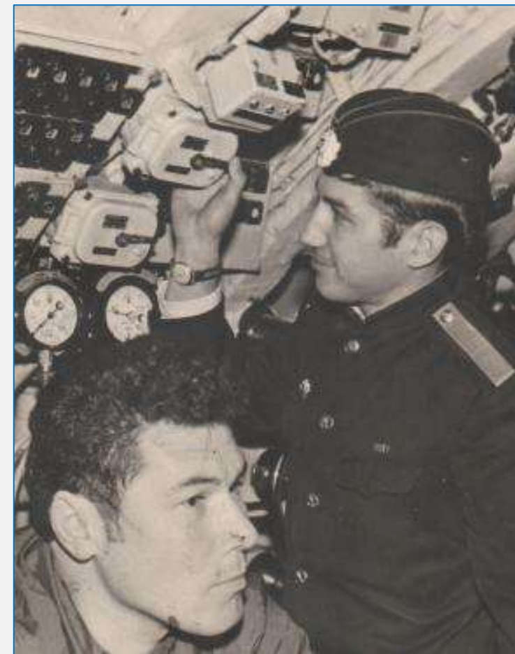
Сентябрь 1966 года, район Фарерских островов, Атлантический океан