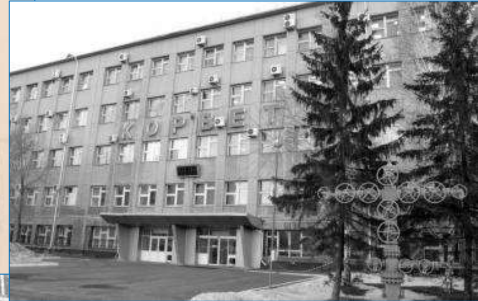
Предприятие «Корвет», г. Курган, 1984 год