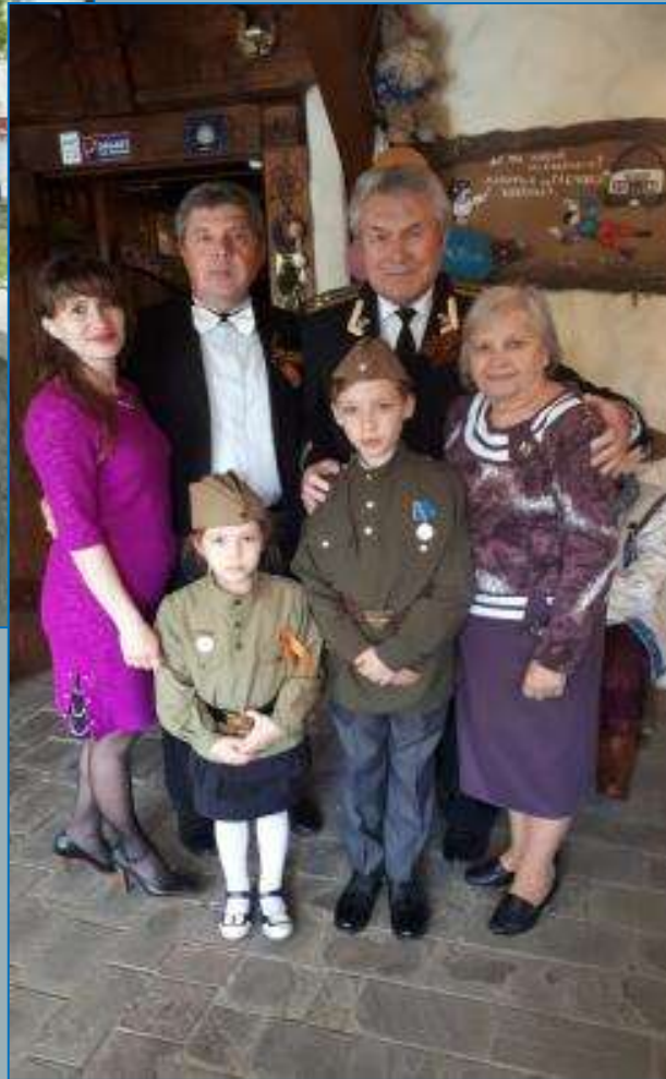
День Победы, 9 мая 2019 года