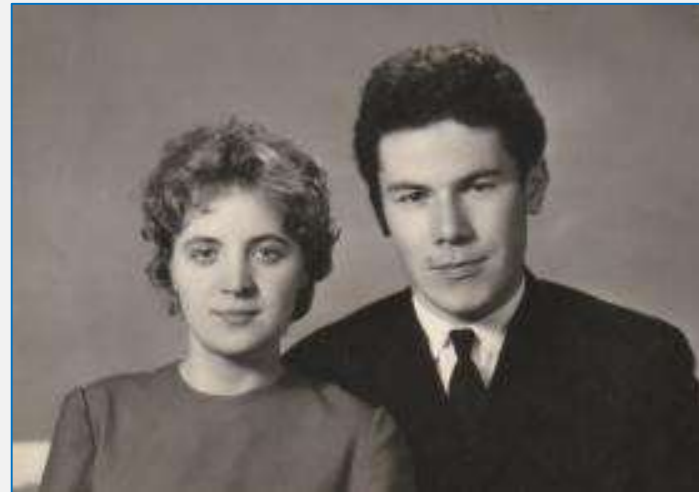
Дедушка и бабушка после свадьбы, 1963 год