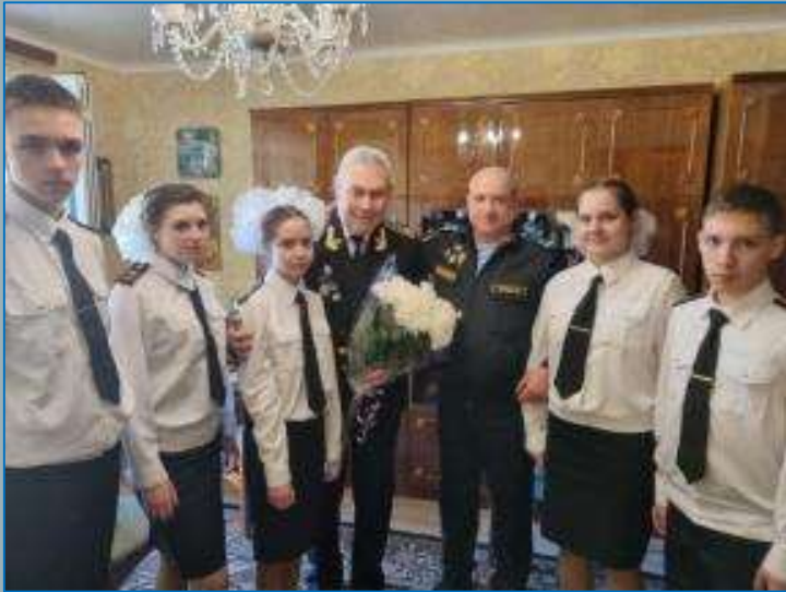
Поздравление кадетами СКК СКР РФ с Днем защитника Отечества, 23.02.2022 года

В 2022 году кадеты 81 взвода Севастопольского кадетского корпуса Следственного комитета Российской Федерации имени В.И. Истомина стали шефами семьи дедушки и бабушки. Во время визитов дедушка делился воспоминаниями о годах службы и давал наставления подрастающему поколению