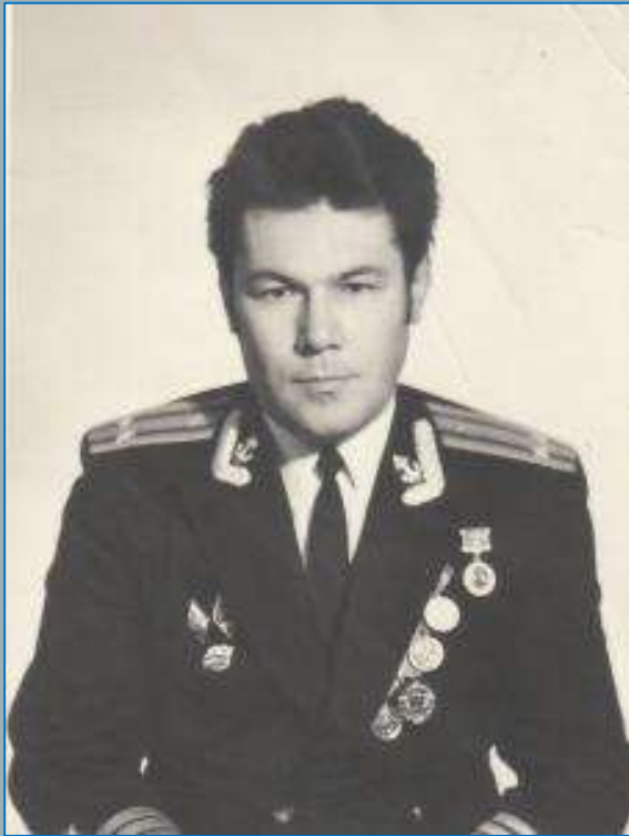
Руководитель военного представительства МО СССР, 1978 год

В 1971 году дедушка по состоянию здоровья был переведен служить в военное представительство МО СССР на военный завод в городе Кургане.