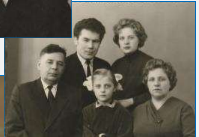
С семьей бабушки, 1963 год