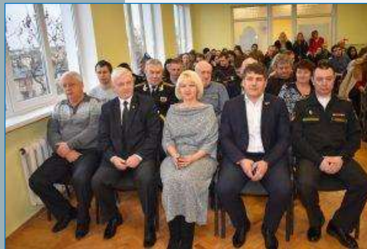
На уроке мужества, посвященном Дню защитника Отечества, в Севастопольском экономико-гуманитарном институте (филиал) ФГАОУ ВО «КФУ им. В.И. Вернадского», 2017 год