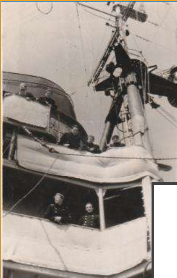
Практика на крейсере «Комсомолец», 1962 год

– Почему выбрал служить моряком-подводником?