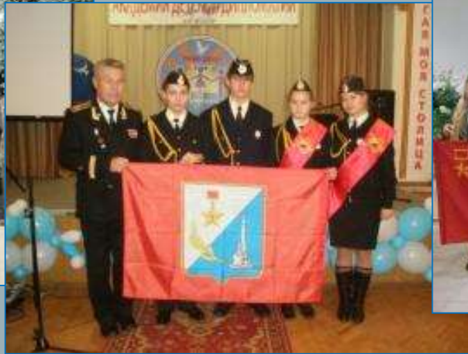
Делегация Севастополя на слете школьников городов-героев стран СНГ. Москва, 2010 год