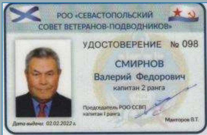
Удостоверение члена организации ветеранов-подводников г. Севастополя

Дедушка, находясь на пенсии, проводит большую военно-патриотическую и общественную работу. До 2022 года он являлся председателем первичной организации ветеранов-подводников