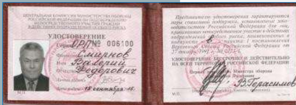
Удостоверение ветерана подразделений особого риска