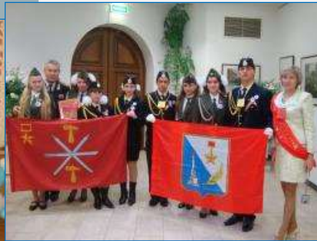
Делегации Севастополя и Тулы на слете школьников городов-героев стран СНГ. Тула, 2009 год