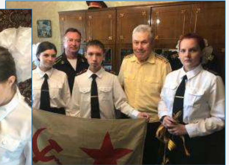
Поздравление кадетами СКК СКР РФ с Днем Победы, 09.05.2022 года