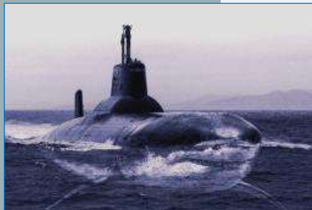
Атомная подводная лодка проекта 941 «Акула»

Образцы боевой техники СССР, за участие в строительстве и освоении которой был награжден дедушка