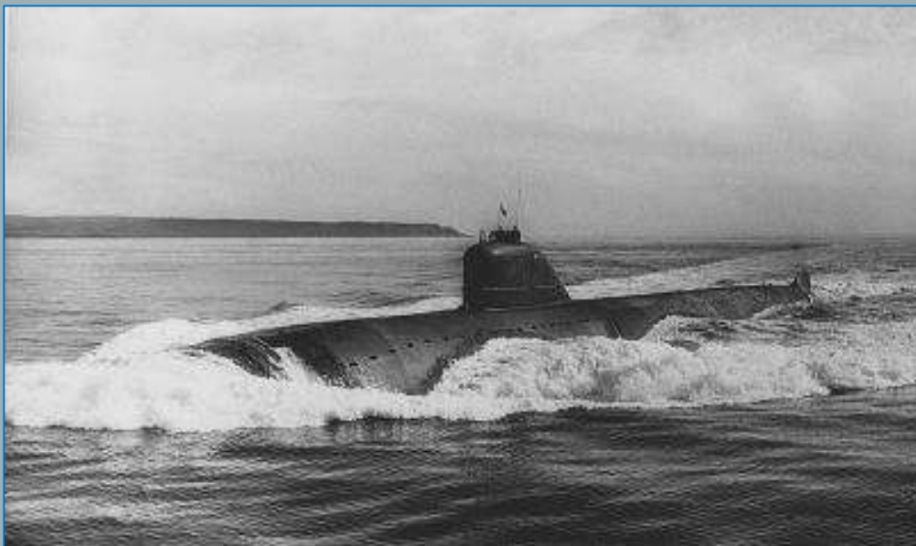
Атомная подводная лодка «К-5» в походе, 1965 год

После окончания военного училища дедушка служил инженером-механиком по эксплуатации АЭУ (атомных энергетических установок) на второй советской атомной подводной лодке «К-5» (проект «627А» типа «Ленинский комсомол»). Является одним из первопроходцев Мирового океана атомными подводными лодками. Участник четырех боевых служб АПЛ (атомная подводная лодка), ветеран подразделений особого риска