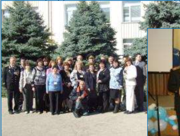
Слет школьников городов-героев стран СНГ. Севастополь, 2011 год

После окончания службы мой дедушка длительное время работал военным руководителем в средней школе № 57 города Севастополя, входил в состав Севастопольского комитета международного союза городов-героев стран СНГ. Он принимает активное участие в военно-патриотическом воспитании молодежи города. Руководил делегации школьников Севастополя на слетах школьников городов-героев в городах Туле, Волгограде, Смоленске, Минске, Москве. В 2011 году такой слет состоялся в Севастополе, за эту работу мой дедушка был награжден Благодарственными письмами правительств городов Москвы и Законодательного Собрания Севастополя. Ему было присвоено звание капитана 1-го ранга в отставке