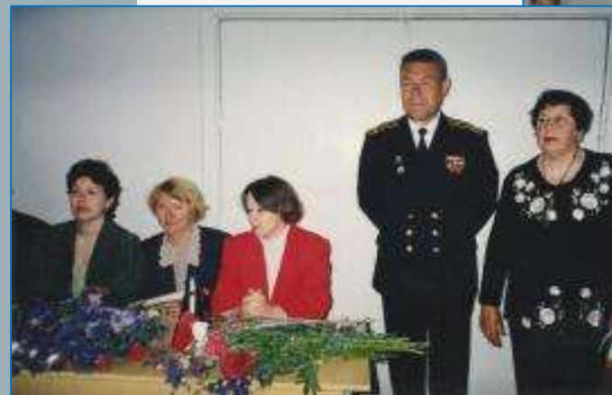
Выступление на празднике, посвященном Дню Победы в СОШ № 57 г. Севастополя, 2012 год