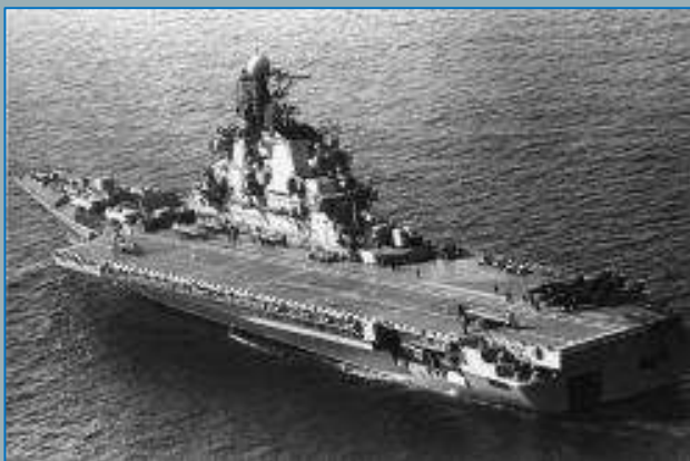
Тяжелый авианесущий крейсер «Киев»

В годы службы в военном представительстве МО СССР дедушка продолжил участие в повышении могущества Военно-морского флота, принимая участия в создании новых образцов военной техники. Это участие было отмечено высокими правительственными наградами, в том числе орденом «За службу Родине в Вооруженных силах СССР» III степени, медалью «За боевые заслуги», многочисленными юбилейными наградами и медалями за выслугу лет. В общей сложности мой дедушка прослужил в Военно-морском флоте СССР 31 год