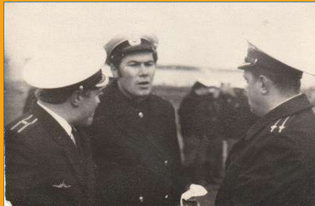
С командиром БЧ-5 и старшим помощником командира корабля, 1967 год