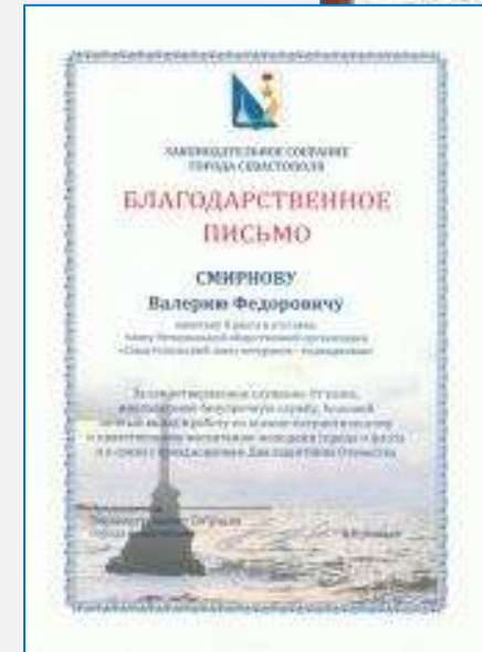
Благодарственные письма Правительства Москвы и ЗС г. Севастополя