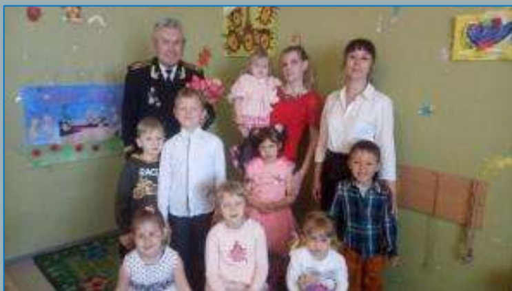
На празднике, посвященном Дню Победы, детский сад «Непоседы», г. Севастополь, 2021 год