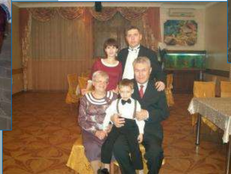
Золотая свадьба дедушки и бабушки, март 2013 года