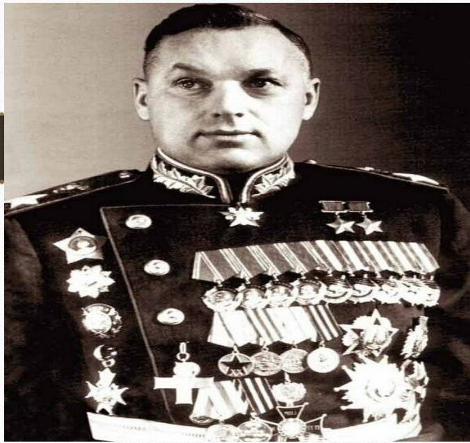
Константин Константинович Рокоссовский

„Только тот народ, который чтит своих героев, может считаться великим.“