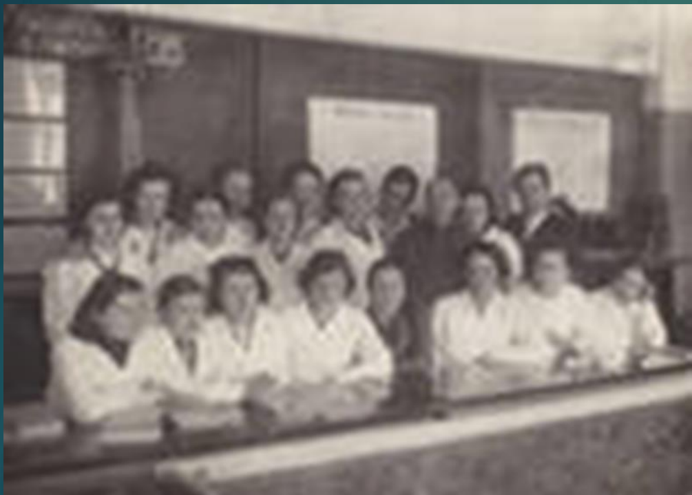
Работа в хирургическом отделении местной больницы.