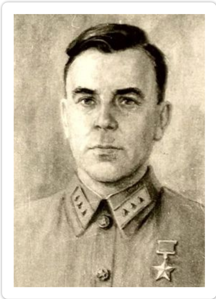
Богатырь Иван Иванович