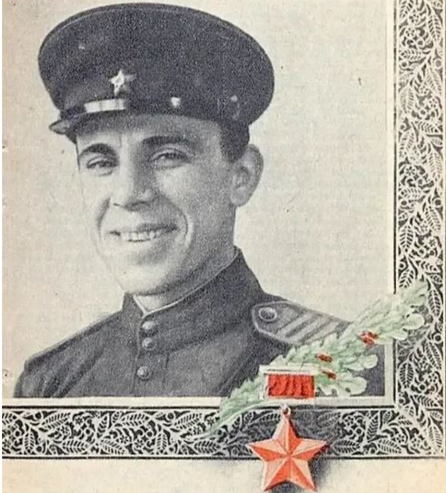
ГЕРОЙ СОВЕТСКОГО СОЮЗА ИВАН ИВАНОВИЧ БОГАТЫРЬ

РАЗВЕДЧИКИ КРАСНОЙ АРМИИ! СМЕЛО ДЕЙСТВУЙТЕ В ТЫЛУ У НЕМЦЕВ! ОБНАРУЖИВАЙТЕ РАСПОЛОЖЕНИЕ И СИЛЫ ВРАГА, РАЗГАДЫВАЙТЕ ЕГО НА- МЕРЕНИЯ И ЗАМЫСЛЫ! ДА ЗДРАВСТВУЮТ БЕССТРАШНЫЕ СОВЕТСКИЕ РАЗВЕДЧИКИ!