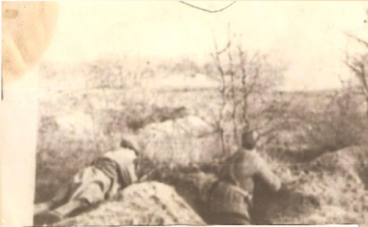
«Рубцовцы» отражают очередную контратаку немцев. Фото 1942 года