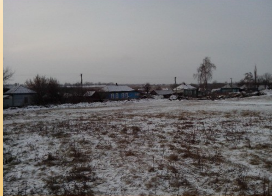
Улица Рубцова (Калинина Слобода)