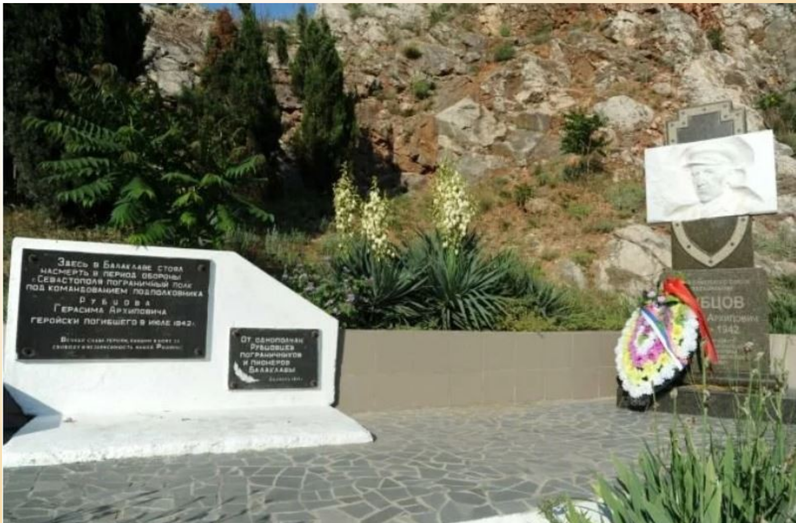
Памятник Герасиму Рубцову и бойцам-пограничникам в Балаклаве