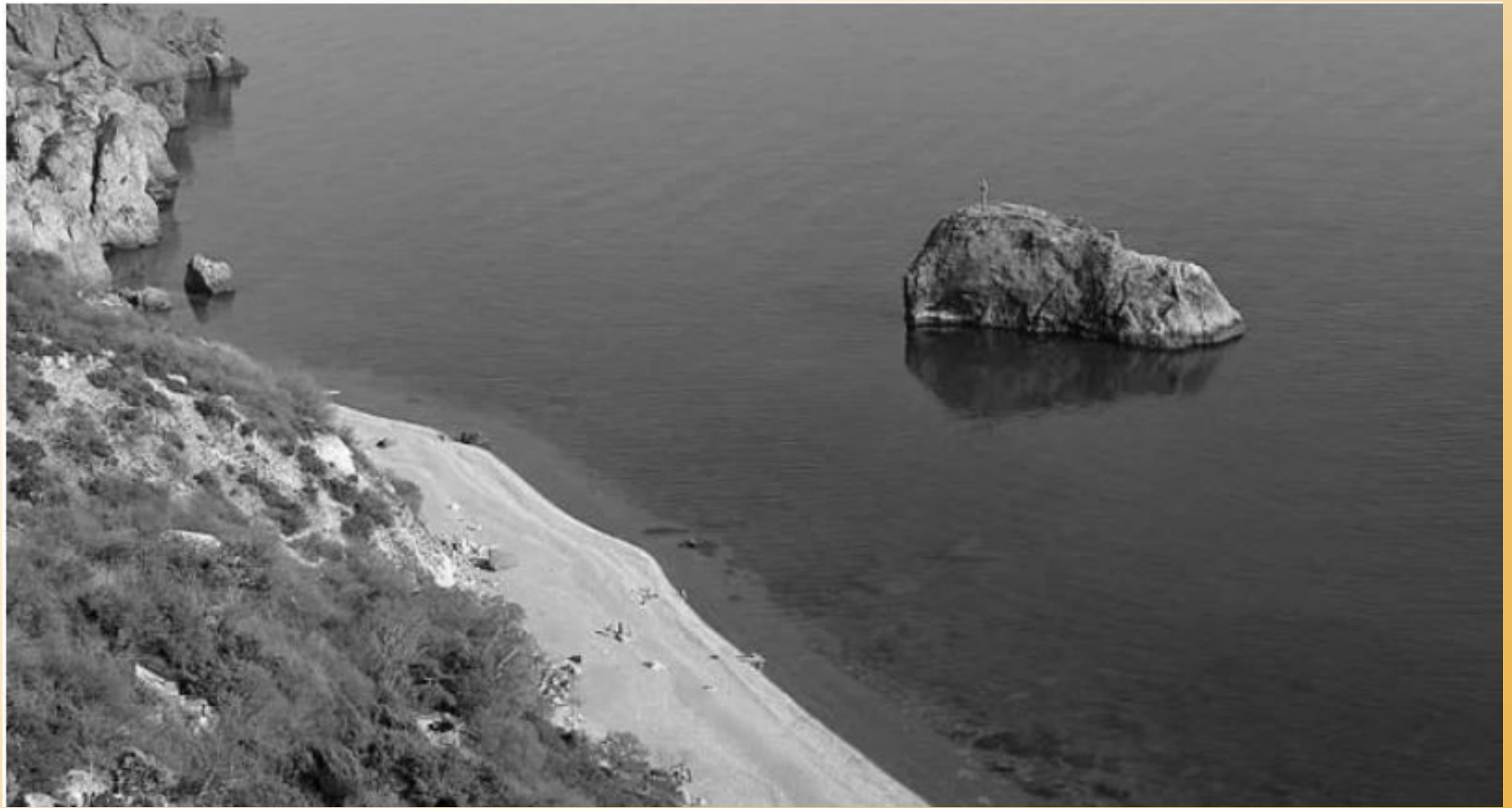
Яшмовый пляж - место последнего боя 465 пограничного полка