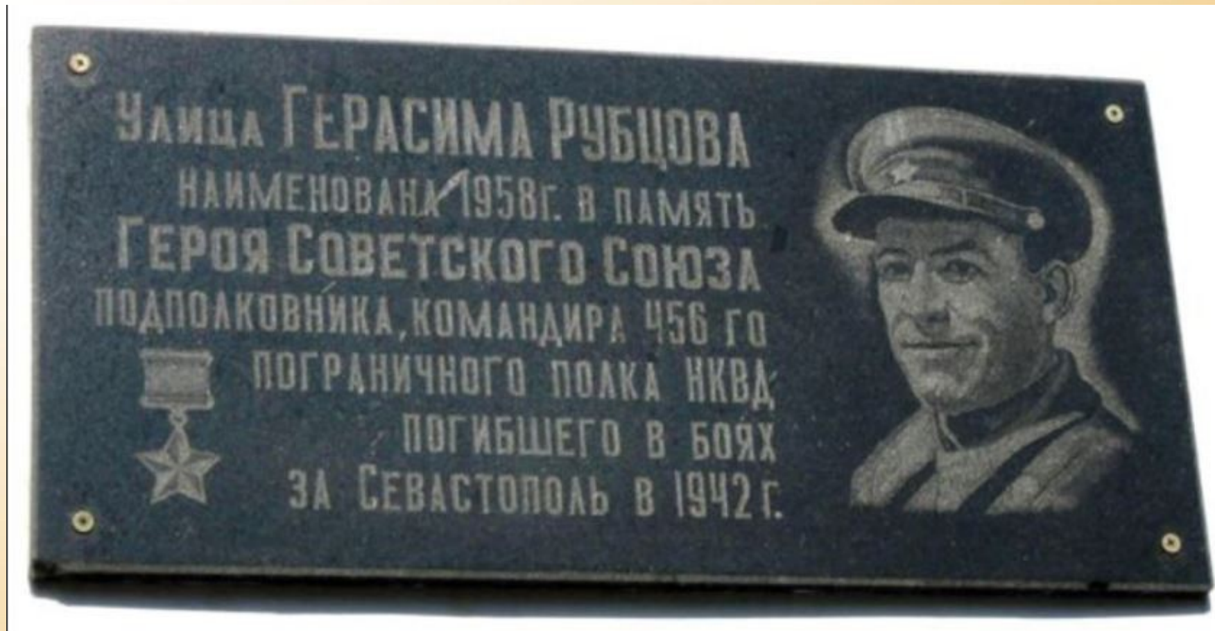
В Балаклаве именем Рубцова названа улица, на доме №17 установлена мемориальная доска.