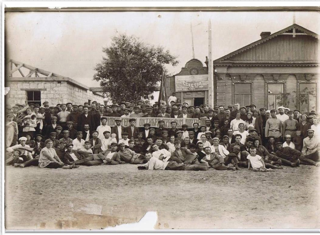
Ст. Ак-булак, центральная площадь.