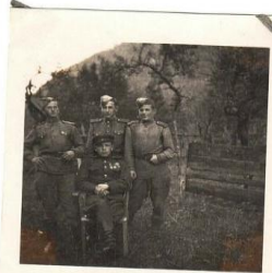
Фото боевых товарищей в Австрии, память о которых дедушка пронес сквозь всю свою жизнь . 1946 год.